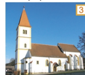
Cerkev Marije Vnebovzete pri Gradu.