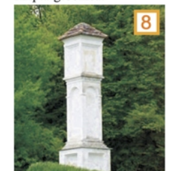
Beli križ-kužno znamenje.