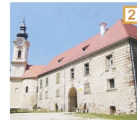
Grad Grad na Goričkem.