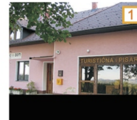
Informacijska pisarna Skouriš.